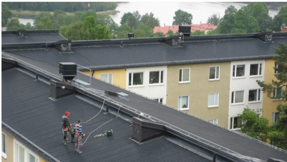
Gubbar på taket tätar skruvhålen.