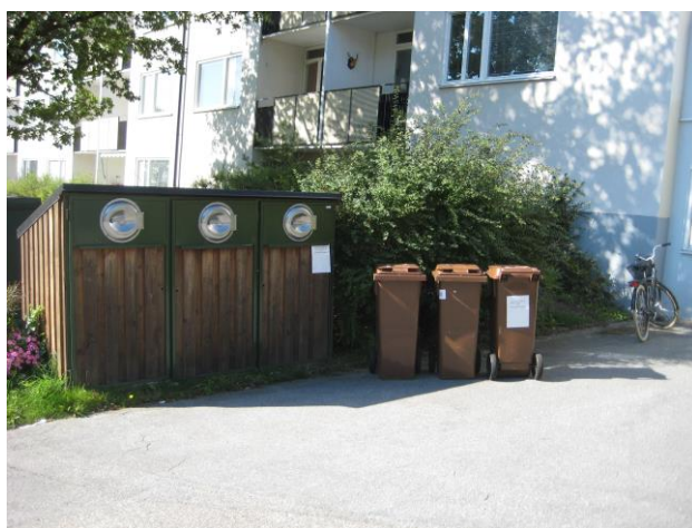
Bruna matavfallskärl till höger