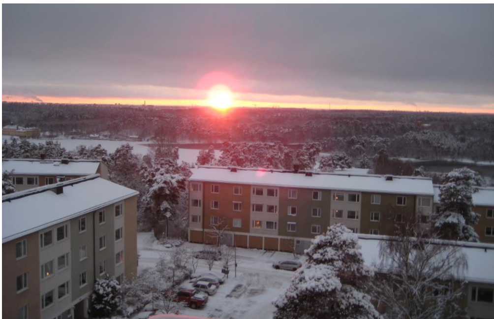
Vinter på Kevingeringen. Utsikt från KR 25,7 tr