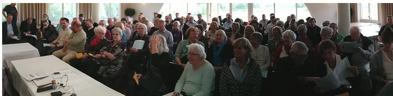
Deltagare på stämman 2015