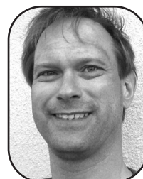
Gustav Mölle Kevingeringen 13, 3 tr

– Det är okej, det är ingen större uppföring.